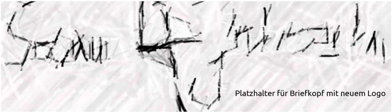
Platzhalter für Briefkopf mit neuem Logo